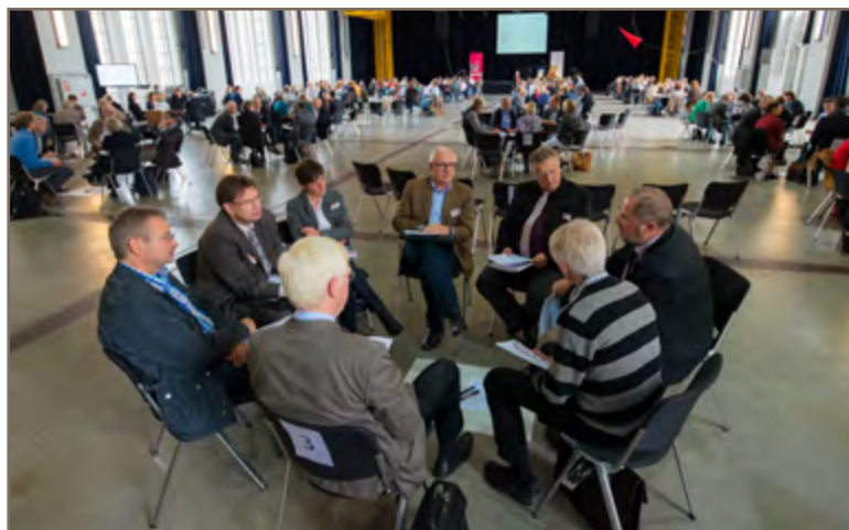
Vertreterinnen und Vertreter der Lernpotenziale Gymnasien im Austausch

Am Nachmittag richteten die Teilnehmerinnen und Teilnehmer den Blick auf die anstehende Implementierung der Projekte in den Schulalltag. Die Schulleiterinnen und Schulleiter diskutierten ihre Rolle sowie Möglichkeiten der Verankerung des Projekts im Kolle-