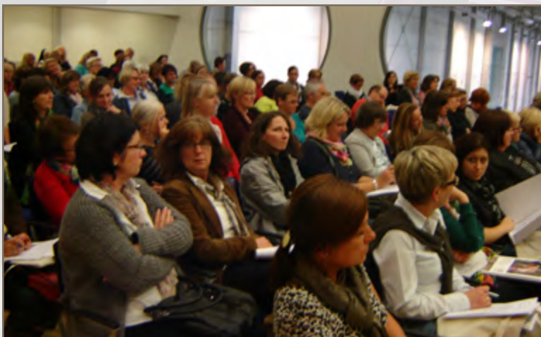
Das größte Forum des Fachkongresses: »Lebensbildung für Eltern und Kinder«

Die Dokumentation des Fachkongresses, die alle Präsentationen bzw. Handouts beinhaltet, ist auf der Webseite www.familienzentren.nrw.de zu finden und kann hier heruntergeladen werden.