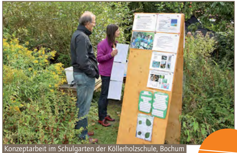
Konzeptarbeit im Schulgarten der Köllerholzschule, Bochum

BNE ist als ein fächerübergreifendes, interdisziplinäres und auf gesellschaftliches Handeln ausgerichtetes Bildungskonzept geeignet, Leitbildentwicklung und Schulentwicklungsprozesse in Ganztagschulen zu unterstützen. Laut Wulf Bödeker (MSW) gelingt die Förderung nachhaltiger Lebensstile vor allem, wenn im Ganztag unterrichtliches und außerunterrichtliches Lernen und Handeln Hand in Hand gehen. Die von SAG NRW, Vernetzungsstelle Schulverpflegung und der Natur- und