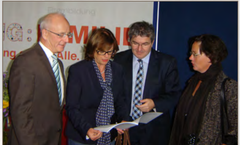
Ministerin Ute Schäfer und Oberbürgermeister Reinhard Paß im Gespräch beim Messerundgang

Der Nachmittag stand ganz im Zeichen des fachlichen Austauschs. Neben der Fachmesse boten hier insbesondere acht Diskussionsforen die Möglichkeit spezifische Themen ausgiebig zu diskutieren. Analog zur Fachmesse war auch hier das Themenspektrum weit gefächert. Im Kontext von Familienzentren wurden die Themen »kul-