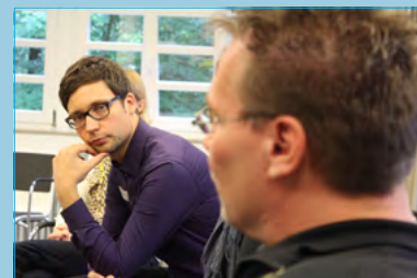
Mehr als 30 Kommunen von »Kein Kind zurücklassen! Kommunen in NRW beugen vor« und des LVR-Programms »Teilhabe ermöglichen – Kommunale Netzwerke gegen Kinderarmut« tauschten sich in Bergisch Gladbach aus.