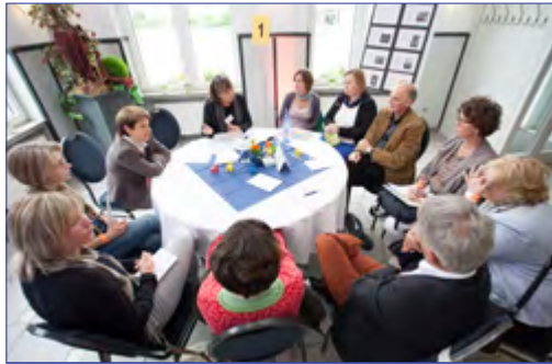
Die VeränderBar war eines der vielen verschiedenen Formate der Ganzttagmesse

In weiteren offenen Formaten wie der »VeränderBar« und den »Themenforen« ergaben sich zahlreiche weitere Gelegenheiten zum Diskutieren mit und Nachfragen bei Expertinnen und Experten aus den Bereichen Organisation und Struktur der Ganzttagsschule, Lebenswelt Schule, Bildung,