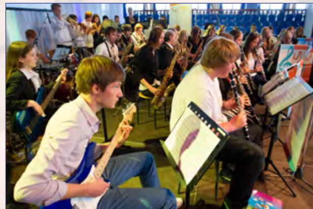
Grandioser Auftakt durch die Schüler-Bigband der Konrad-Adenauer-Realschule

Sie besuchten u.a. die Gebrüder-Grimm-Grundschule Hamm, die ganztägig ihre Leitbegriffe »lachen-leisten-lesen« in enger Verzahnung vom Vor- und Nachmittagsbereich unter Einbezug der Eltern als »Lehrende und Lernende (!)« umsetzen, die Hanseschule Attendorn, die als neue Sekundarschule das Motto »Jedes Kind im Blick« hat, und den »Kulturrucksack NRW«, ein Landesförderprogramm des Ministeriums für Familie, Kinder, Jugend, Kultur und Sport mit dem zentralen Ziel, die Verbesserung der Teilhabe an Kunst und Kultur gerade auch für Kinder und Jugendliche in schwierigen Lebenslagen zu ermöglichen.