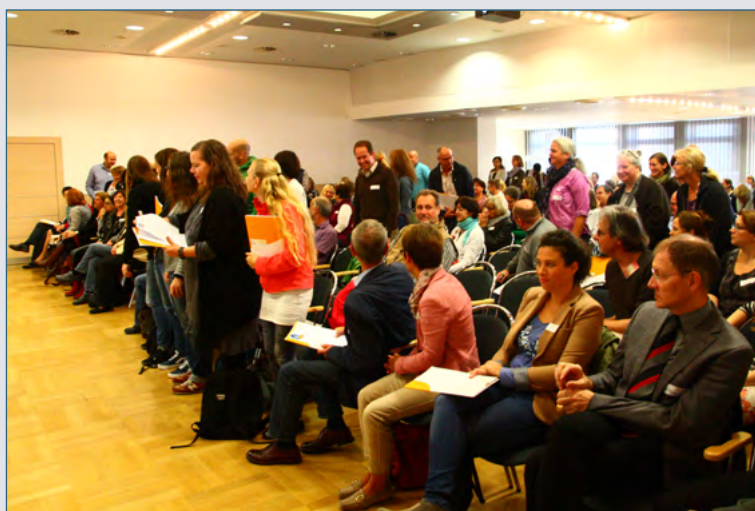
Die Teilnehmenden des Forum Ganztagschule NRW starten in den »rhythmisierten Tagesablauf«.

Eine grundlegende Voraussetzung und somit wichtiger Bestandteil der Antwort auf diese Fragen ist ein rhythmisierter Tagesablauf mit einem Wechsel von Anspannung und Entspannung, der die Kinder und Jugendlichen in den Mittelpunkt stellt. In Anlehnung daran war auch die Veranstaltung selbst konzipiert: Nach einem offenen Beginn wechselten sich Vorträge und interaktiv gestal-