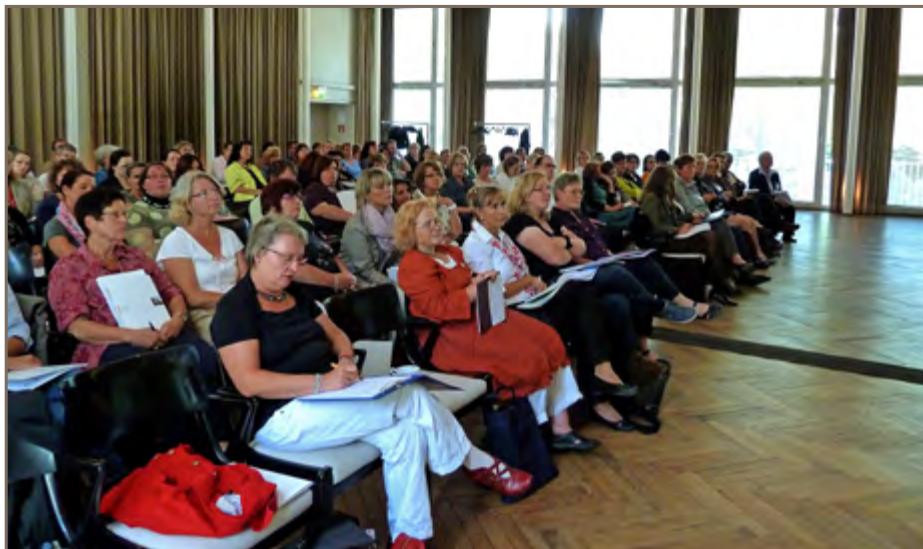
Die Teilnehmenden der Informationsveranstaltung zur Erst-Zertifizierung am 06.09.2012

Die inhaltliche Ausgestaltung der Informationsveranstaltungen am 06.09. (Zertifizierung), 19.09. (Re-Zertifizierung), 24.10. (Zertifizierung) und 30.10. (Re-Zertifizierung) setzt auf Altbewährtes, baut aber auch neue Elemente ein: Wie auch in den vergangenen Jahren erhalten die teilnehmenden Fachkräfte aus den Familienzentren und Kindertageseinrichtungen Informationen über Inhalt, Ablauf und Organisation der Zertifizierung bzw. Re-Zertifizierung nach dem aktuellen Gütesiegel durch