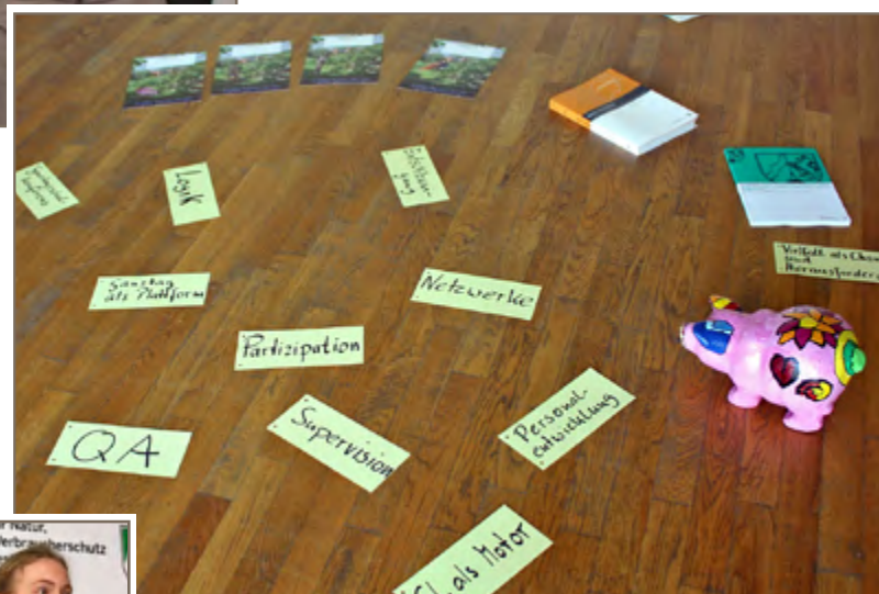
Workshop-Impressionen BNE und Schulprogrammentwicklung

Vier Workshops gaben den knapp 60 Teilnehmerinnen und Teilnehmern der Tagung einen Einblick in Aufbau und Einsatzmöglich-