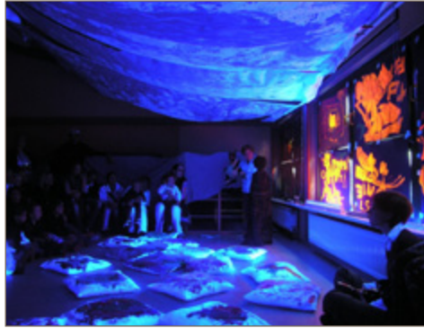
Rauminstallation in Solingen

und Nacht, wie Sonne und Mond« beschrieb eine Erzieherin den Unterschied, »aber am Ende lief es rund«. Die Erfahrung, sich auf ein gemeinsames Projekt einzulassen, trotz Widerständen und Konflikten dabei zu bleiben und schließlich etwas kreativ zu schaffen, was mit Stolz erfüllt und An-