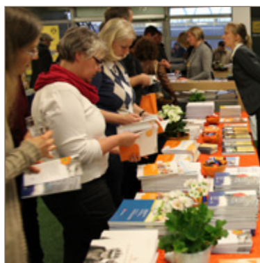
Interessierte TeilnehmerInnen am ISA-Stand