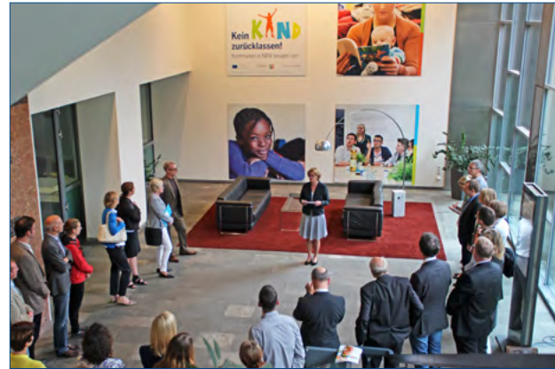
Ausstellungseröffnung im Düsseldorfer Familienministerium: Bis zum 31. Oktober ist die Fotodokumentation dort zu sehen.

Die Titel der verschiedenen Phasen lauten: »Schwangerschaft & Geburt«, »Frühe Kindheit«, »Mittlere Kindheit«, »Übergang in die Grundschule«, »Späte Kindheit«, »Jugendliche« und »Erfolg in der Schule – Sprungbrett zum Erwachsensein«. Daneben gibt es zwei